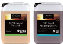
Die neu gestalteten TOP Grundierungen, Spachtelmassen und Kleber

Über einen QR-Code auf der Verpackung gelangt man mit dem Smartphone auch auf der Baustelle direkt zur Produktseite im Internet und zu allen relevanten technischen Informationen.